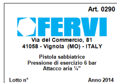
Figura 2 – Targhetta di identificazione

Sulla confezione della pistola sabbiatrica Art. 0290 è presente la seguente targhetta di identificazione