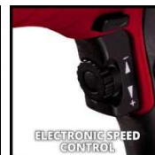
ELECTRONIC SPEED CONTROL