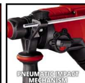
PNEUMATIC IMPACT MECHANISM